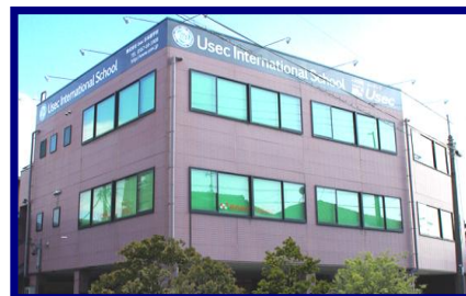
Usec インターナショナルスクール