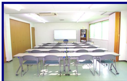
Usec 教室 3A