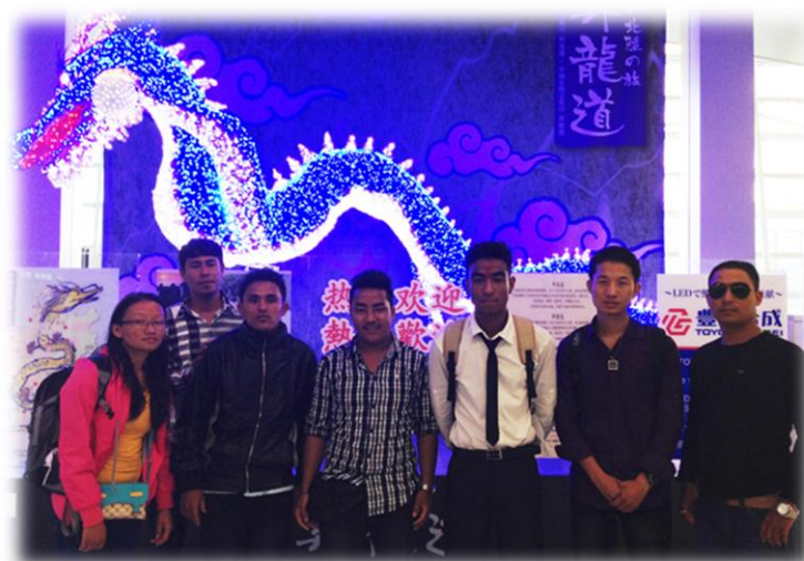
(UIS 1 期生来日)